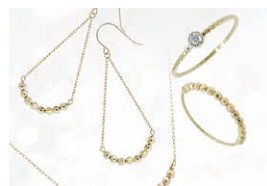
▲ライトジュエリー