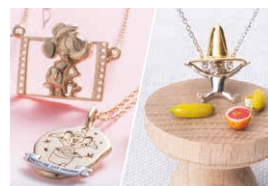
▲キャラクター商品